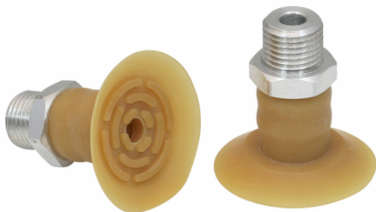
SGPN 34 NK-40 G1/4-AG