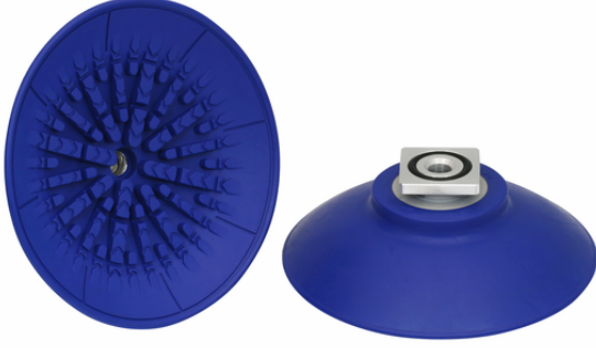
SAF 125 NBR-60 RA

Çeşitli çaplarda mevcut olan vantuz SAF, elastomer parçaya vulkanize edilmiş bağlantı nipeli ile birlikte teslim edilir.