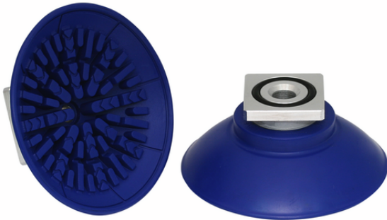
SAF 80 NBR-60 RA

La ventosa SAF, disponibile in diversi diametri, viene con nipplo di connessione vulcanizzato a la parte in elastomero.