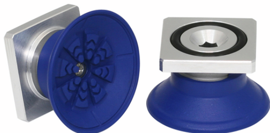
SAF 40 NBR-60 RA

La ventouse SAF, disponible en différents diamètres, est livrée avec insert de connexion vulcanisé à la pièce en élastomère.