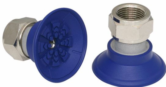
SAF 40 NBR-60 G3/8-IG

La ventosa SAF, disponibile in diversi diametri, viene con nipplo di connessione vulcanizzato a la parte in elastomero.