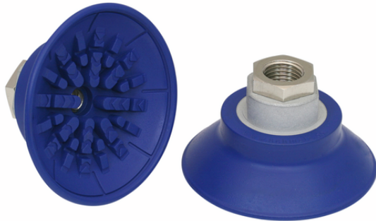
SAF 60 NBR-60 G1/4-IG

La ventosa SAF, disponibile in diversi diametri, viene con nipplo di connessione vulcanizzato a la parte in elastomero.