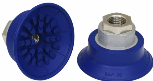
SAF 50 NBR-60 G1/4-IG

真空パッド SAFは、接続ニップル (取付ネジ) が取り付けられた状態で納品されます。様々なサイズのパッドをラインアップしています。