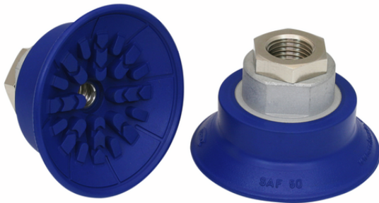
SAF 50 NBR-60 G1/4-IG

La ventouse SAF, disponible en différents diamètres, est livrée avec insert de connexion vulcanisé à la pièce en élastomère.