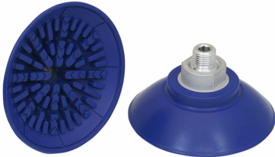
SAF 80 NBR-60 G1/4-AG

La ventouse SAF, disponible en différents diamètres, est livrée avec insert de connexion vulcanisé à la pièce en élastomère.