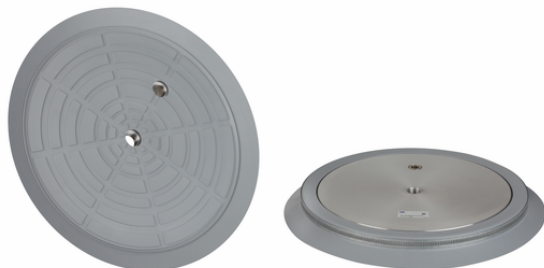
SPU 360 NBR-55 G1/2-IG B