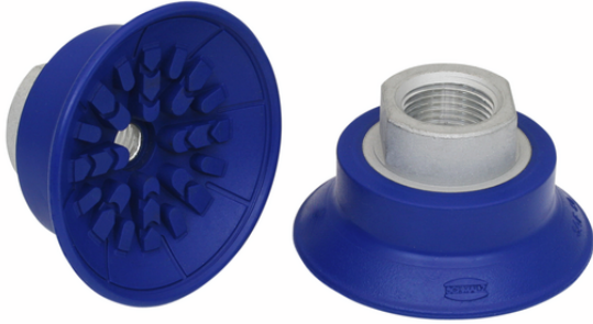
SAF 50 NBR-60 G3/8-IG

La ventouse SAF, disponible en différents diamètres, est livrée avec insert de connexion vulcanisé à la pièce en élastomère.