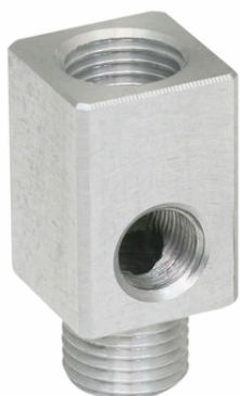
ANW G1/8-IG G1/4-AG

El adaptador para conexión acodada ANW se suministra como producto listo para su conexión.