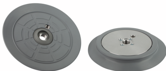
SPC 210 NBR-55 G1/2-IG