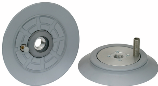
SPC 160 NBR-55 G1/2-IG TV