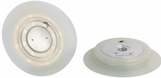
SPU 160 SI-60 G1/2-IG AE

La placa de ventosa SPU (junta anular + placa soporte) se suministra montada. El producto se compone de: