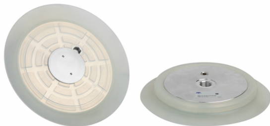
SPU 210 SI-60 G1/2-IG AE