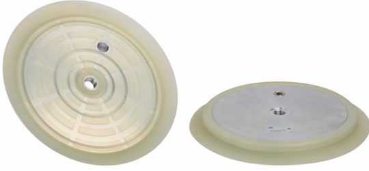
SPU 300 SI-60 G1/2-IG

Vakum plakası SPU (sızdırmazlık halkası + destek plakası) monte edilmiş olarak teslim edilir. Montaj şunlardan oluşur: