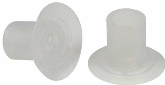
SGP 30 SI-50 N033