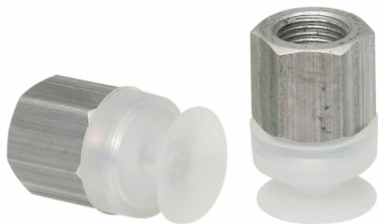
SGAN 16 SI-55 G1/8-IG