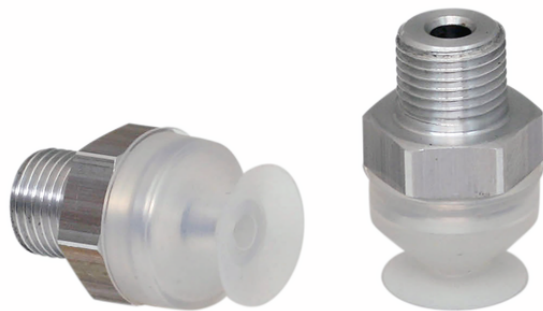
SGAN 13 SI-55 G1/8-AG

真空パッド SGAN: パッドにネジが取り付けられた状態で納品されます。以下の製品で構成されます。