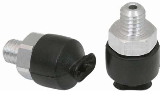
SGON 4x2 NBR-55 M3-AG