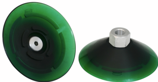
PFYN 95 VU1-72 G1/4-IG