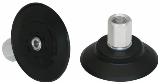
PFYN 60 NBR-55 G1/4-IG

La ventosa PFYN (parte in elastomero + nipplo di connessione) viene fornita non montata (a partire da diametro 120 mm montata). La fornitura è costituita da: