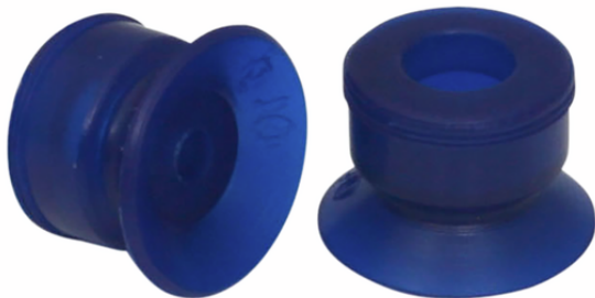
PFG 10 PU-55 N004