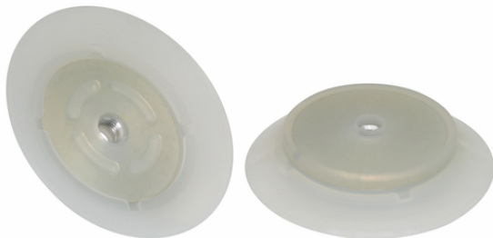
PFG 95 SI-55 N009 M10x1.25-IG